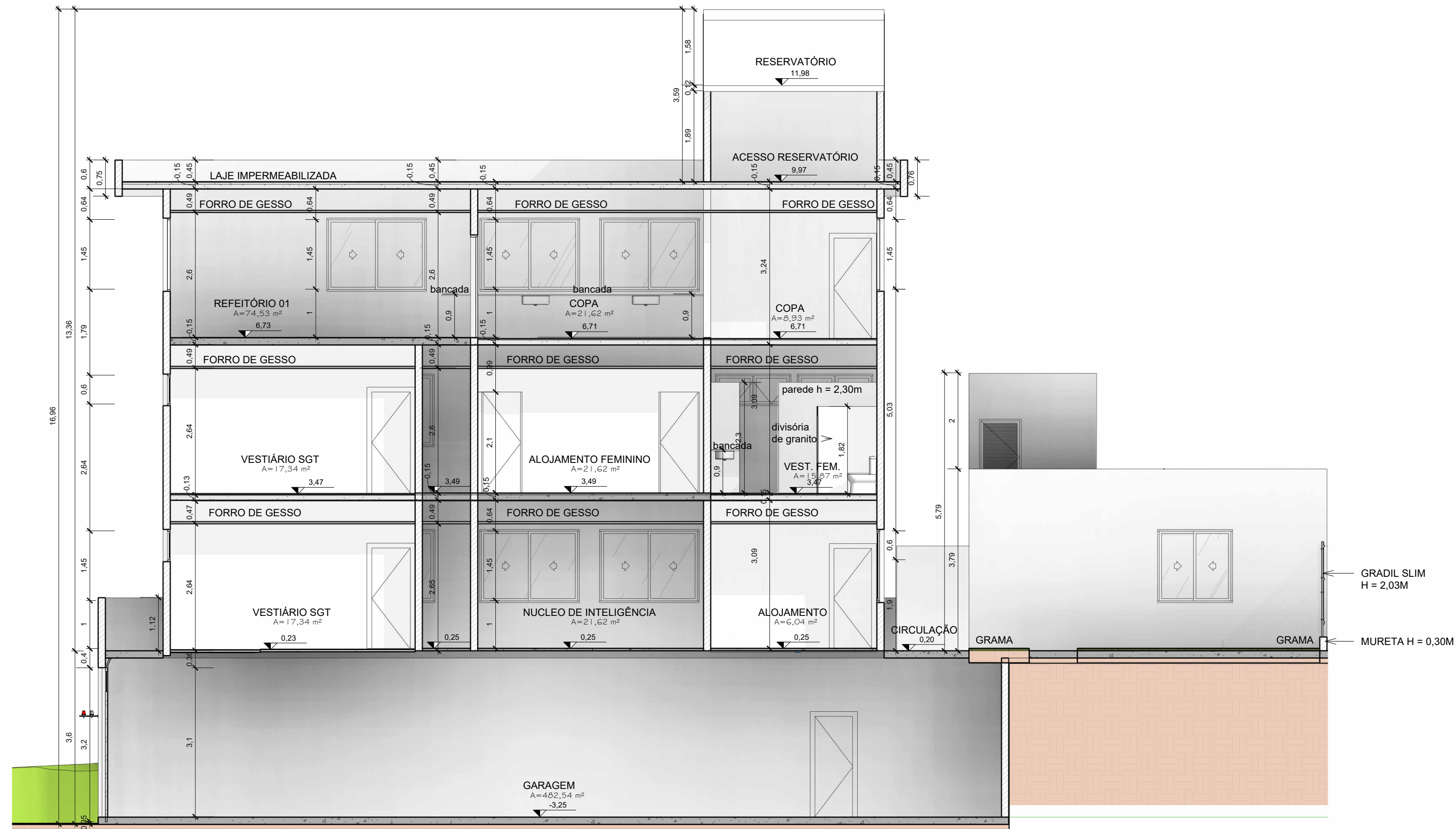
BPCAATINGA - Corte 4 ESCALA 1 : 75